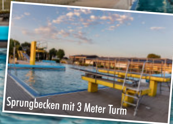
Sprungbecken mit 3 Meter Turm