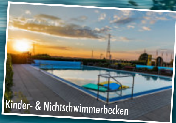
Kinder- & Nichtschwimmerbecken