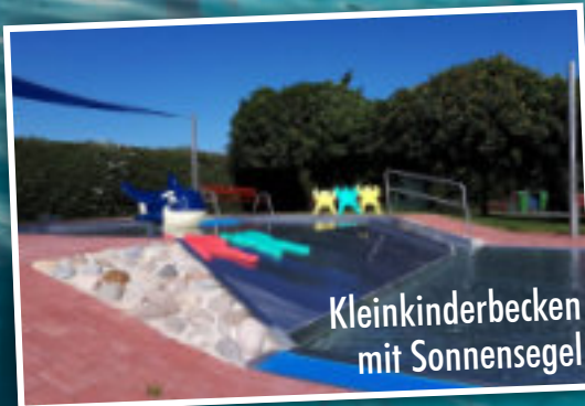
Kleinkinderbecken mit Sonnensegel