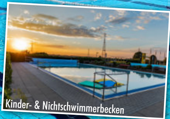
Kinder- & Nichtschwimmerbecken