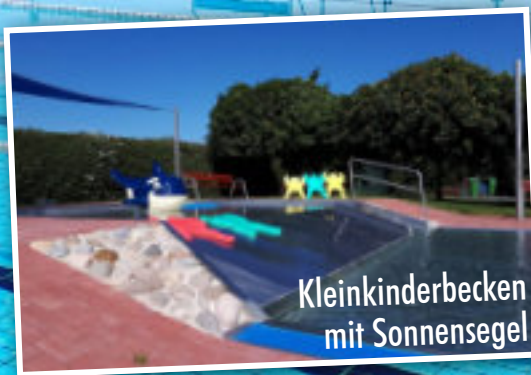
Kleinkinderbecken mit Sonnensegel